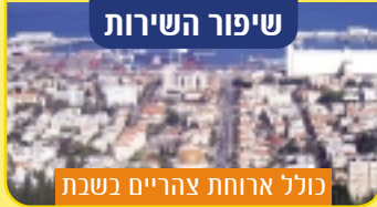
כולל ארוחת צהריים בשבת