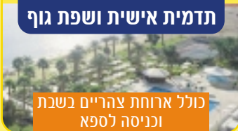
כולל ארוחת צהריים בשבת וכניסה לספא