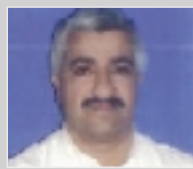
דברים שלא ידעת על מוסטפא חמוד:

גם מתי לוותר. לפעמים מוותרים על דבר אחד כדי להשיג משהו אחר. אסור אף פעם ללכת עם הראש בקיר".