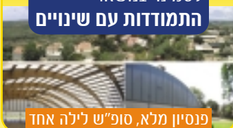
פנסיון מלא, סופ"ש לילה אחד