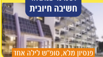
פנסיון מלא, סופ"ש לילה אחד