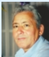
דברים שלא ידעת על אלימלך שלו

מה המשימות שלך לשנה הבאה? "לצד קידום תנאי העבודה של העובדים, אני מבקש לחזק את הצד החברתי וגיבוש העובדים באמצעות מפגשים משפחתיים בין העובדים ובנוסף, לפתוח קורסים נוספים לעובדים אשר יתגמלו אותם כלכלית והשכלתית".