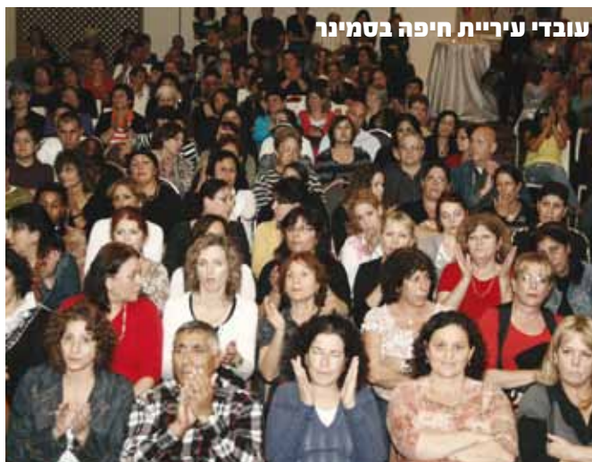
עובדי עיריית חיפה בסמינר

כולל אירועי ערב לקבוצה מעל 100 חדרים בהשתתפות אמן אורח. במהלך חודש מאי יתקיים באילת סמינר ייעודי שהורכב לצרכי העובדים בעיריית חיפה. הסמינר, שעוסק בנושא "העצמה אישית ומקצועית ככלי למציאות" כולל תמהיל יוצא דופן ומרתק של תכנים ואווירה.